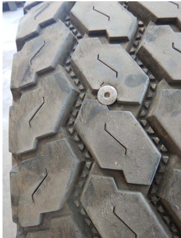
Impressionen aus der Disol-Werkstatt in Querétaro